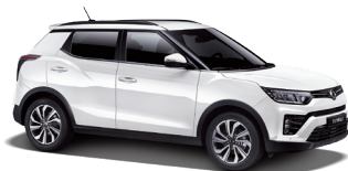
Grand White (WAA)