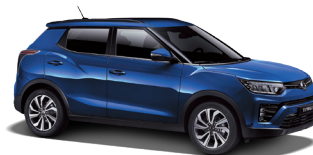
Dandy Blue (BAS)*