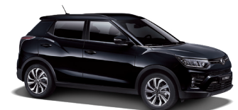
Space Black (LAK)*