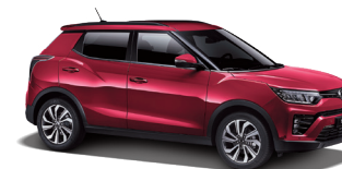
Cherry Red (RAV)*