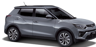
Platinum Gray (ADA)*